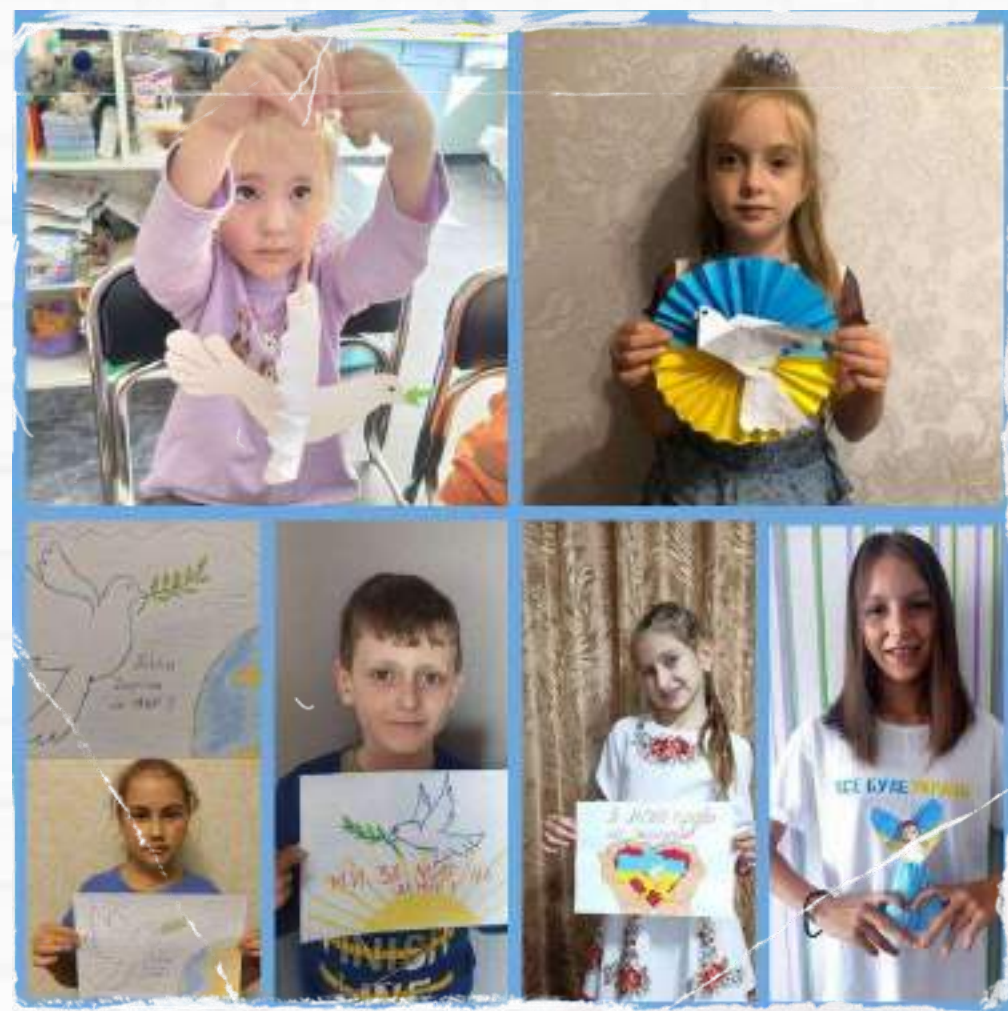
Обласна акція-флешмоб «Голосуємо за МИР!»