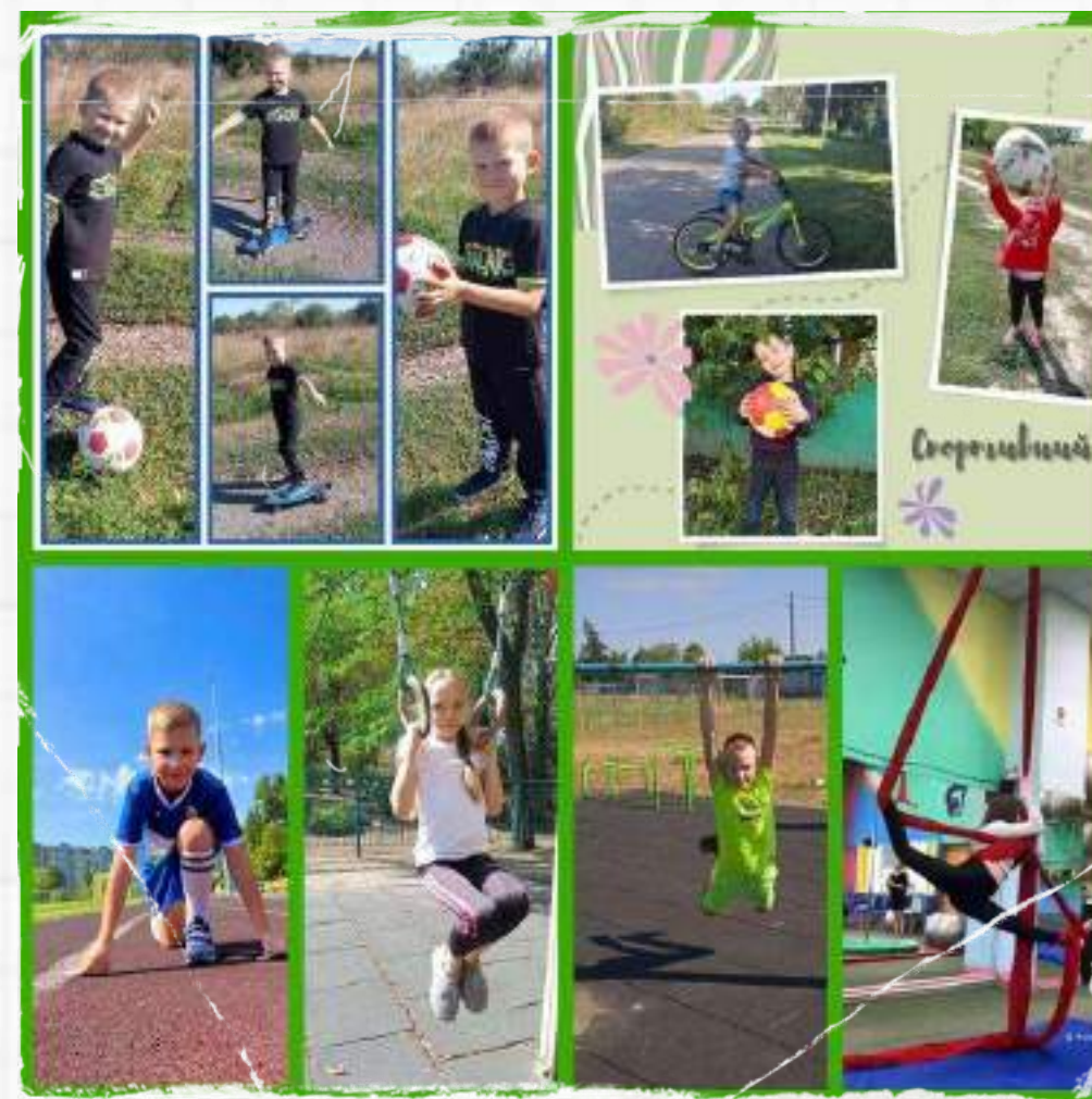
Обласний челендж-марафон «Швидкі, спритні та зав'язані»